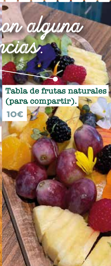
Tabla de frutas naturales (para compartir).